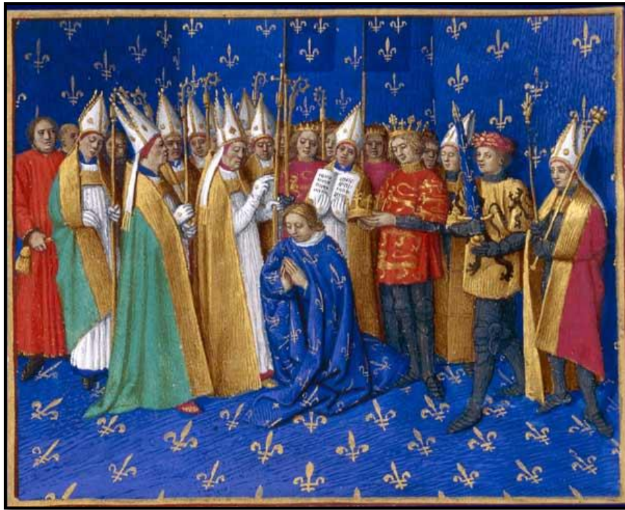
Coronación de Felipe Augusto II de Francia ( Grandes Chroniques de France, enluminées par Jean Fouquet, Tours, vers 1455-1460 )