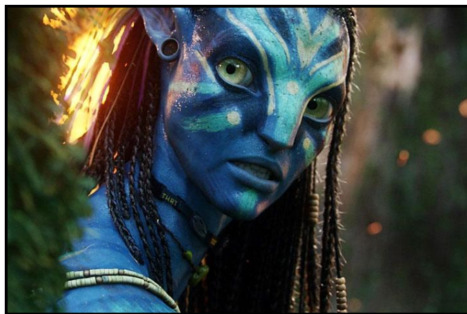
El Arquetipo femenino, según Cameron. (Cuidado con hacerla enojar)