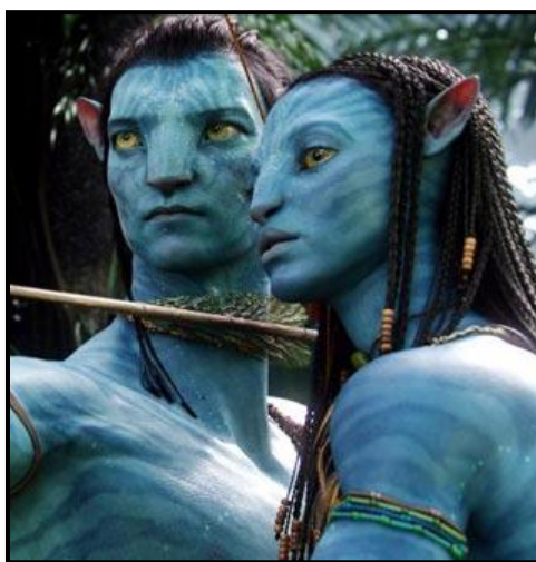
El de los Na'Vi. ¿Un film para Na'Bos?