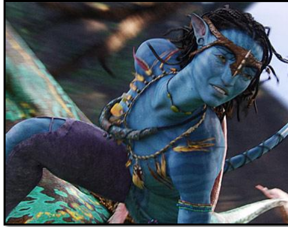
I am Free! (¿Publicidad de cosméticos naturales?)